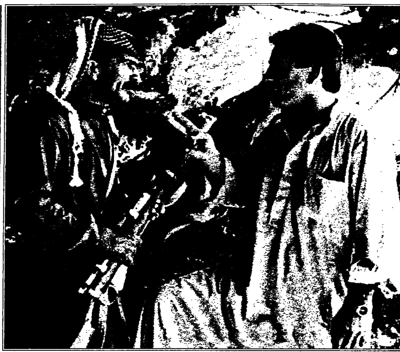
لقطة من المسلسل الاردني «عمران»